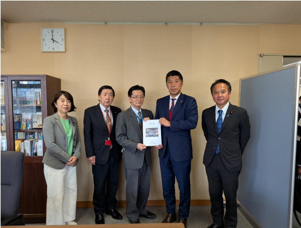
左から、山本佐知子参議院議員、村山繁生四日市市議会議長、五十嵐徹人局長、森智広四日市市長、石原正敬衆議院議員