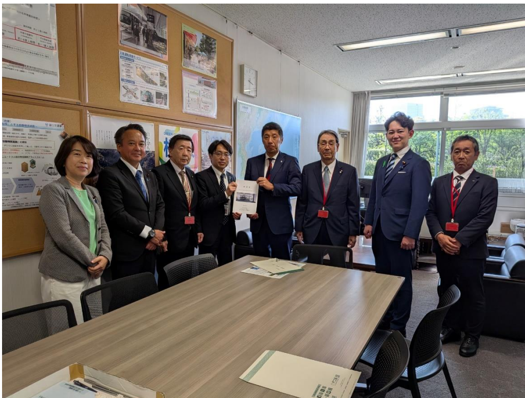
左から、山本佐知子参議院議員、石原正敬衆議院議員、村山繁生四日市市議会議長、沓掛敏夫道路局長、森智広四日市市長、小川謙四日市商工会議所会頭、川崎ひでと衆議院議員、高柳伸浩三重県四日市建設事務所長