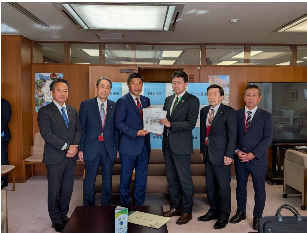
左から、石原正敬衆議院議員、小川謙四日市商工会議所会頭、森智広四日市市長、廣瀬昌由技監、村山繁生四日市市議会議長、高柳伸浩三重県四日市建設事務所長