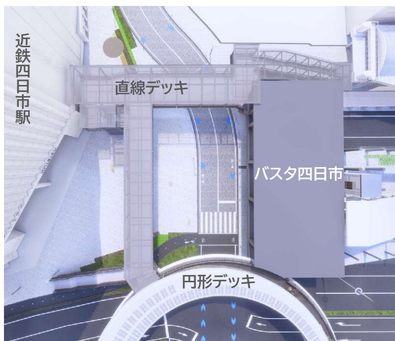
バスタ四日市と駅を直結する円形デッキと直線デッキ

また、「バスタ四日市」への期待から、周辺地域ではホテルやオフィス、マンションの立地といった大型の民間投資が相次ぐとともに、市としても図書館の整備や大学の誘致を進めており、今後、さらなる都市機能の集積や交流人口の増加を図ってまいります。