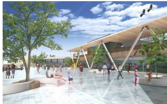
整備事例 道の駅「くるくるなると」 (徳島県鳴門市)