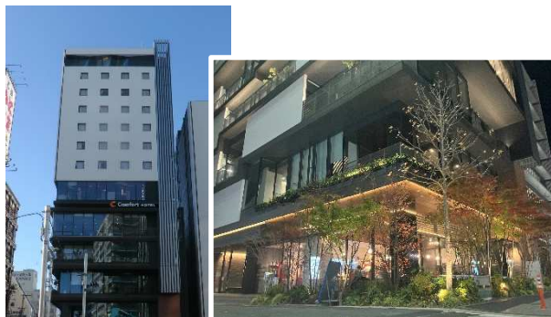
ホテル・オフィスの立地