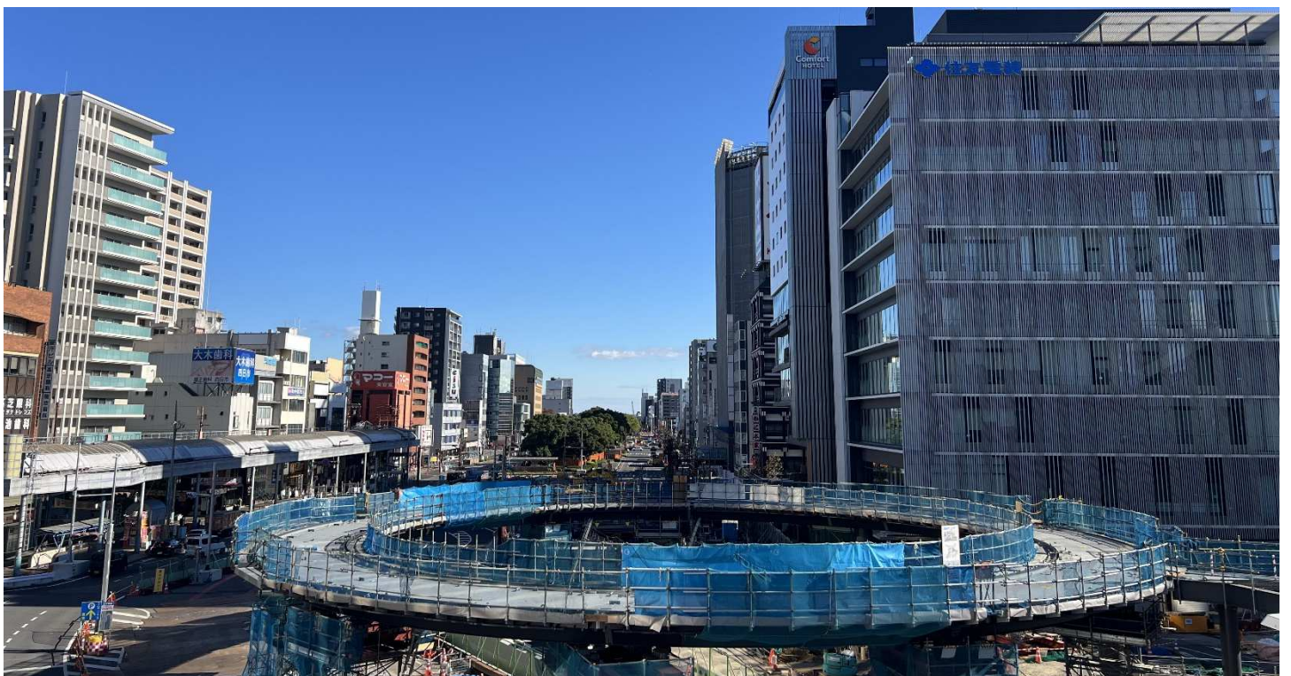
円形デッキの工事状況

「バスタ四日市」への期待から、周辺地域ではホテルやオフィスの立地といった大型の民間投資が相次いでおり、より一層地域の期待も高まってまいりました。