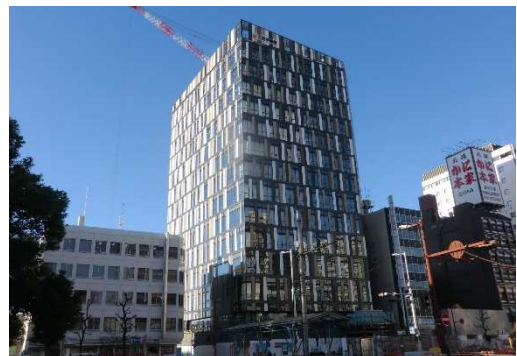
建設中のオフィス(2025年春完成予定)