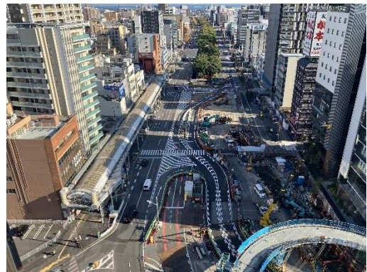
バスタ四日市周辺の工事状況