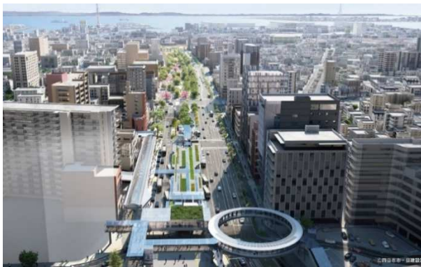
バスタ四日市を結ぶ円形デッキ