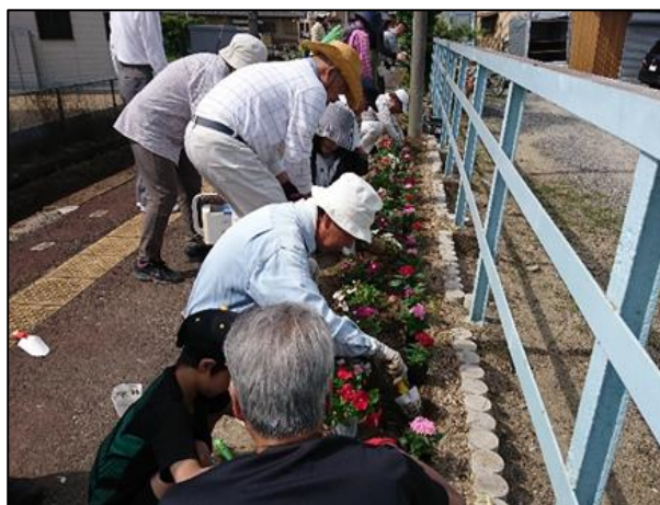
花植え作業の様子