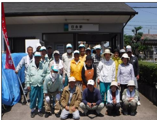
清掃作業をしていただいた皆様