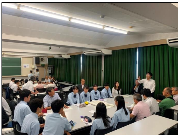
沿線高校・地域が連携したシンポジウム

今後も、地域の皆さまから愛着の持てる身近な鉄道として、安心・安全で信頼できる鉄道であり続けていくため、皆さまのご意見をいただければ幸いです。