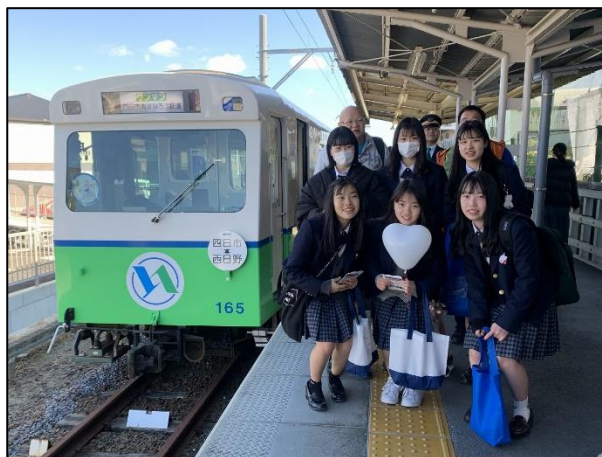
沿線高校・地域主催のイベント列車