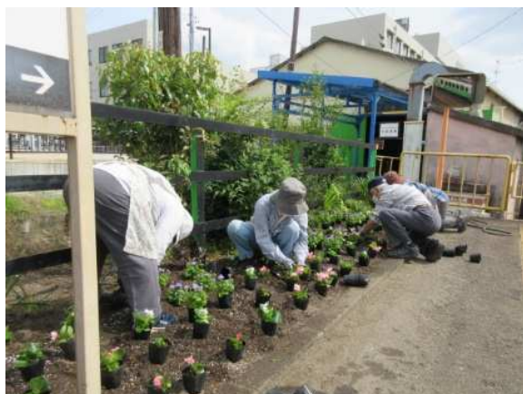
花植え作業の様子（沿線地域の協力）

今後も、地域の皆さまから愛着の持てる身近な鉄道として、安心・安全で信頼できる鉄道であり続けていくため、皆さまのご意見をいただければ幸いです。