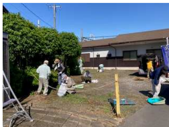
清掃活動の様子（沿線地域の協力）