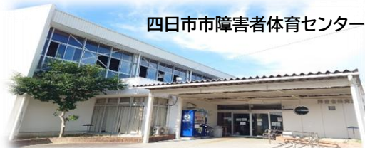
四日市市障害者体育センター