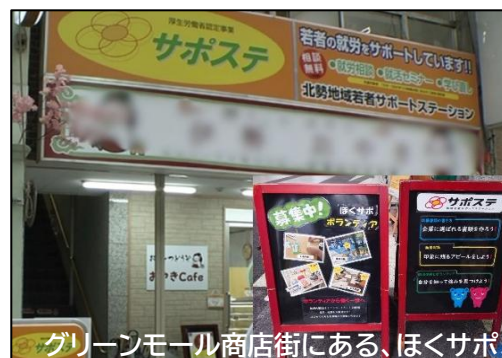
グリーンモール商店街にある、ほくサポ