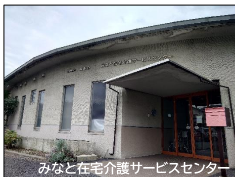
みなと在宅介護サービスセンター

つながることで、困りごとを相談したり助け合ったりでき、地域課題の解決につながる効果を感じることができました。