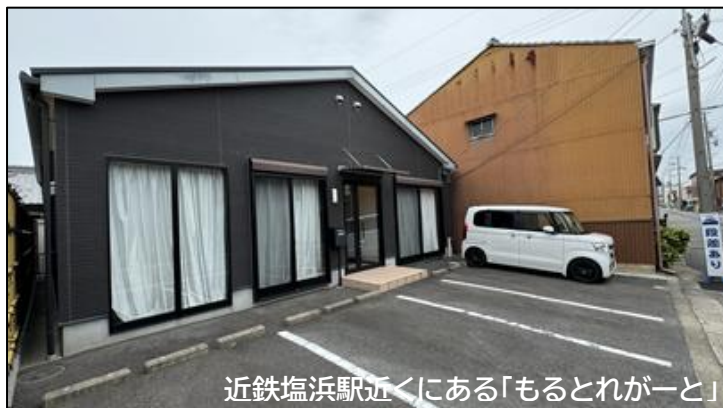
近鉄塩浜駅近くにある「もるとれがーと」

どうしても保護者だけで悩みがちになります。もるとれがーとでは、保護者だけでも相談ができます。また、経済的事情により、フリースクールに通いたくても通えない子どももいます。もるとれがーとは、令和 7 年度三重県事業「フリースクールで学ぶ子どもたちへの支援事業補助金対象フリースクール」となっており、利用料の一部が補助されます(補助対象条件あり)。