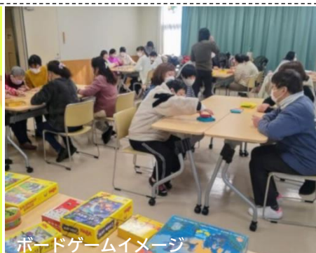
ボードゲームイメージ