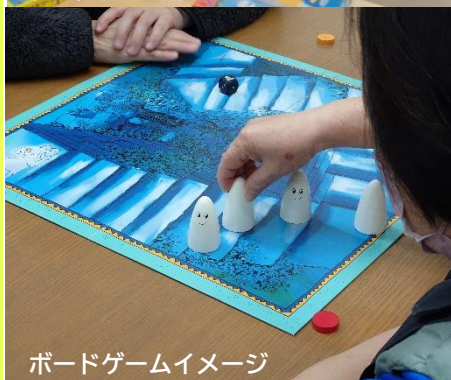
ボードゲームイメージ