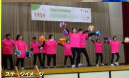
ステージイメージ

子ども、高齢者、外国人、障害者、若者、生活困窮者等々、さまざまな人の居場所の、分野を超えた交流の場として、第1回「四日市居場所交流会」を2025年3月20日(木祝)13:00~16:00、四日市市文化会館第4ホールにて開催します。