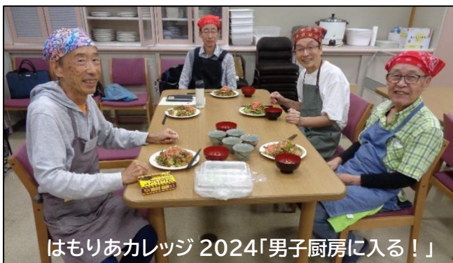
はもりあカレッジ 2024「男子厨房に入る！」

同会は、「実定年後は今までの縦の関係ではなく、前職の肩書などは語らない、誇らない、聞かない、昔の会社のことは聞かれても言わない、をルールに横のつながりを大切にする楽しいサークルです。特に定年後は外に出ることが大事です。家にこもっていないで是非お出かけ下さい。」とおっしゃっていました。