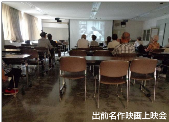
出前名作映画上映会