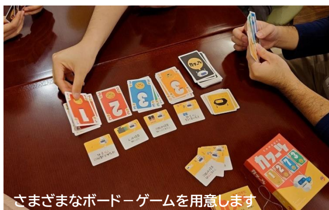
さまざまなボードゲームを用意します