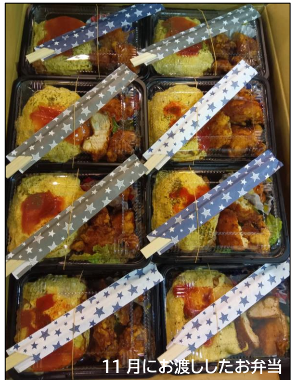
11月にお渡ししたお弁当

また、児童厚生員や保育士の資格者が運営しているので、子どもや保護者の相談に応じたり必要な機関につないだりしています。