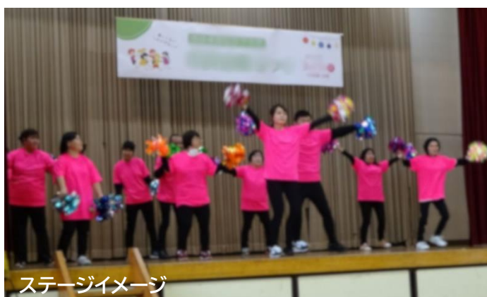
ステージイメージ