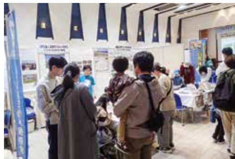
昨年度の四日市市環境フェア

今回は、ヒノキや貝がらなど自然の材料を使った工作体験や、環境を守る取り組みの展示などを予定しています。