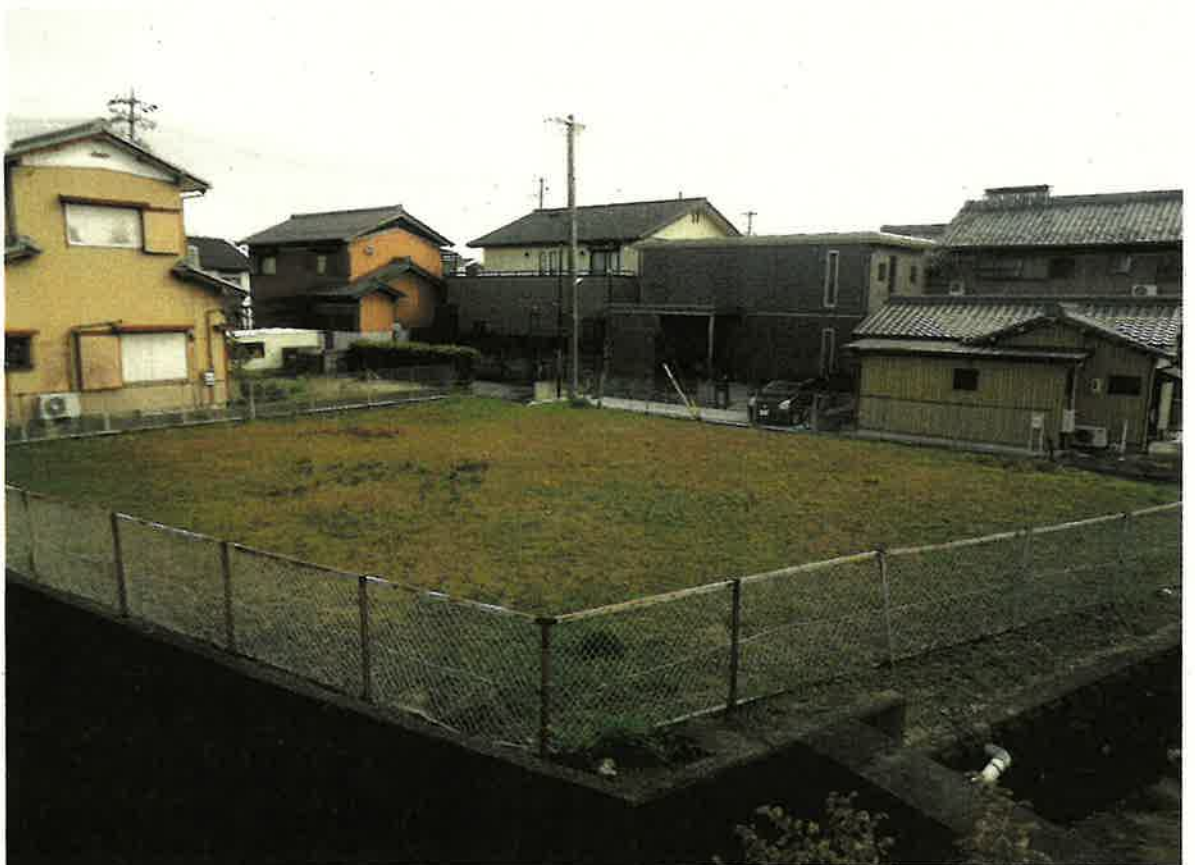
対象不動産 遠景(北西側より)