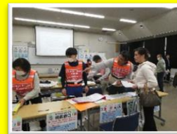
避難所設置、外国人避難者受入の準備