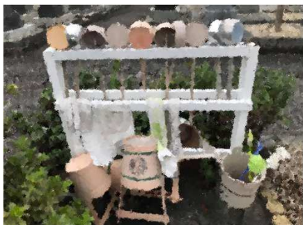
水場、手洗い場など

屋外のブロック、プランター、庭石や墓石の間やくぼみ、排水溝の側面、グレーチングの裏、マンホールの裏など。雨風が直接当たらない場所など