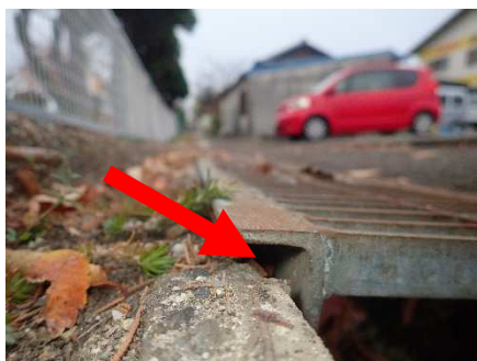
グレーチングの隙間