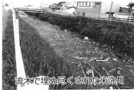
流木で埋め尽くされた米洗川

12月議会では、持続可能で地域活性化につながる自伐型林業についても提案しました。毎年、台風や豪雨の後には、管理不全の山林から多くの木々が四日市港まで流されてきます。もしこの流木が河川で詰まって天然ダムを形成すると、川の氾濫を誘発して大変危険です。また、近年全国的に多発する土砂災害の多くは、林業による皆伐や大型作業道が起因していると言われています。