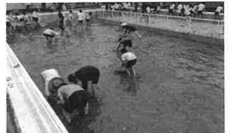
プール掃除の様子。囲園地帯にある学校のプールは土や葉が風でプールに飛来し、掃除も一苦労。

このように多くのメリットを有し、地域課題を解消する可能性のある自伐型林業を本市も推進すべきと考えます。