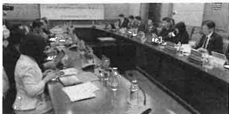
ハイフォン市との会談の様子

現在、市内企業の多くは、人材不足に悩んでおり、外国人労働者を雇用する企業が増加しています。この傾向は今後ますます拡大していくと考えられます。そこで、ハイフォン市との連携もさることながら、現在すでに日本国内に在住する多くのベトナム人にアプローチすることが最も効果的と考えます。彼らはSNSなどでかなり強いネットワークを有しており、これをいかに活かして、企業の人材不足を解消するかが重要です。