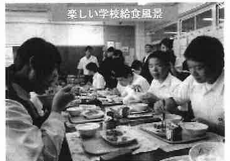
楽しい学校給食風景