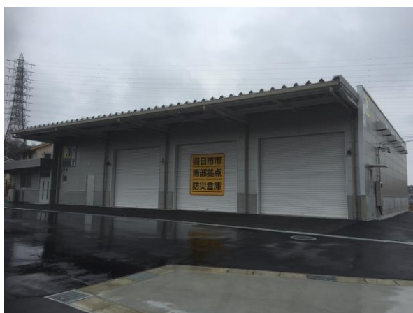
南部拠点防災備蓄倉庫

各指定避難所に防災倉庫を併設するほか、5カ所に防災備蓄倉庫を設置し、食料（ビスケット、アルファ米等）や毛布、簡易トイレ、プライベートルーム、ワンタッチ式パーテーション、簡易ベッド、エアーマットのほか、ノコギリ、ツルハシ、ハンマー、パール、担架等の救出救助用資機材の備蓄に努めている。同様に、水防倉庫についても整備・充実にも努めている。（令和5年4月時点防災倉庫は126カ所、水防倉庫は54カ所）