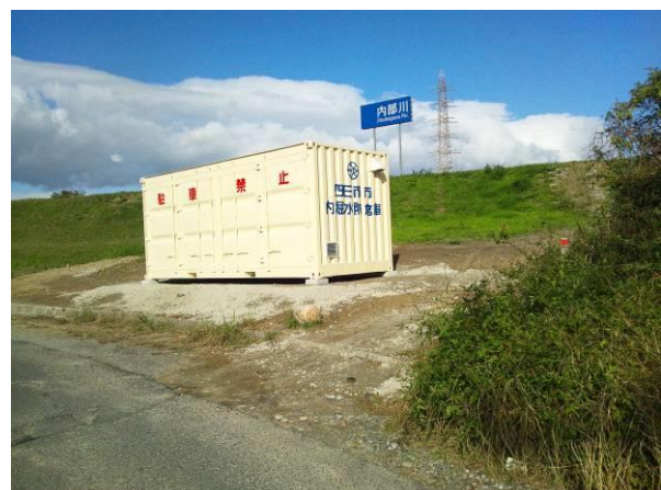
水防倉庫（内堀:内部川）