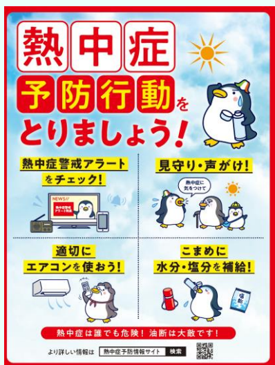
熱中症予防ポスター