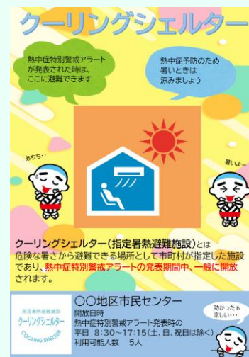
クーリングシェルターポスター