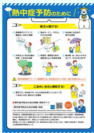
熱中症予防チラシ