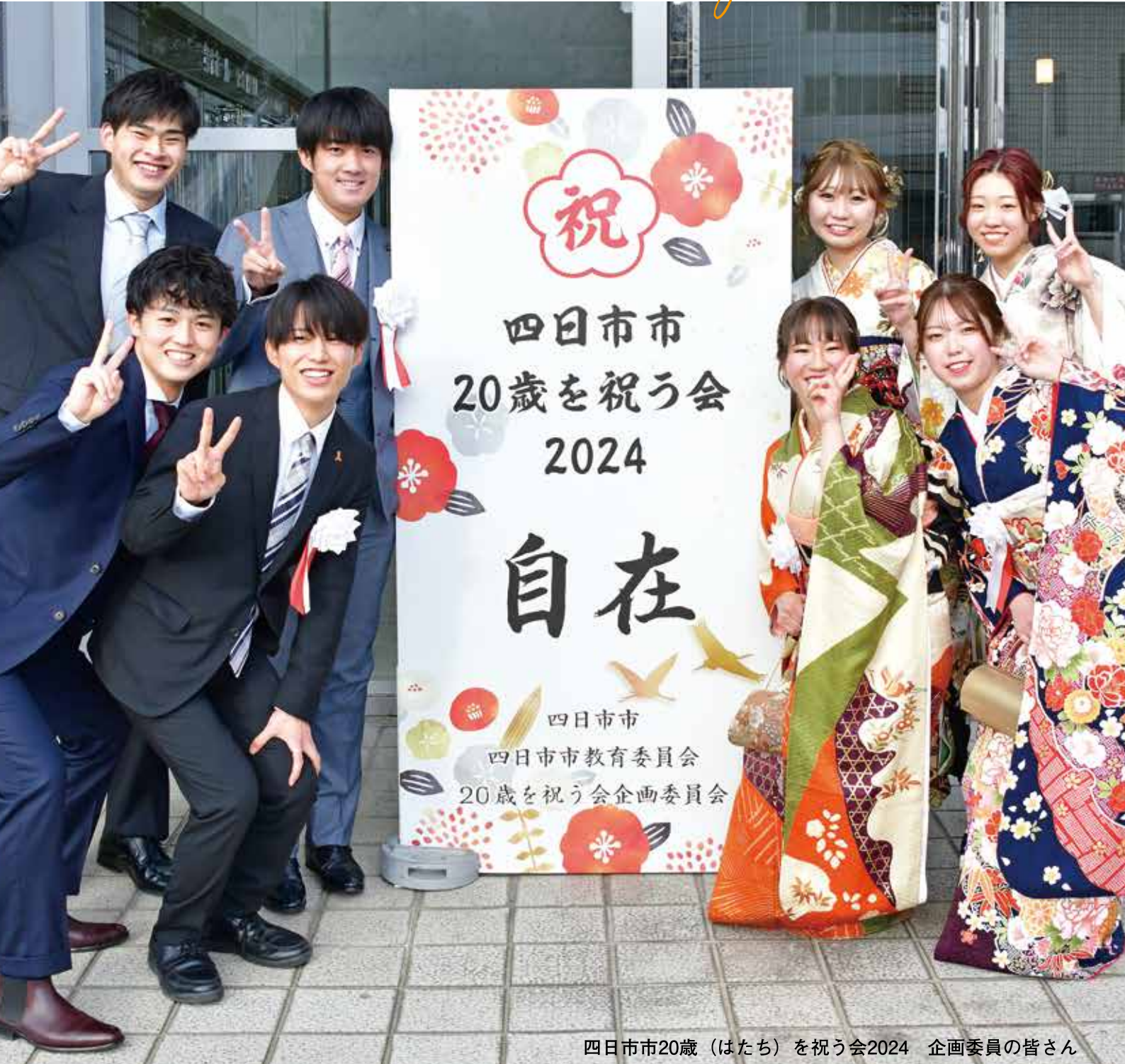
四日市市20歳（はたち）を祝う会2024 企画委員の皆さん