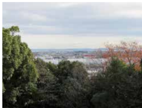
忘歸處より東を望む風景

三神山頂上から東を望むと、晴れた日には、御嶽山や伊勢湾を挟んで知多半島まで見渡すことができます。頂上には、ベンチも整備されています。これから暖くなる時期に、景色を楽しみに登ってみませんか。