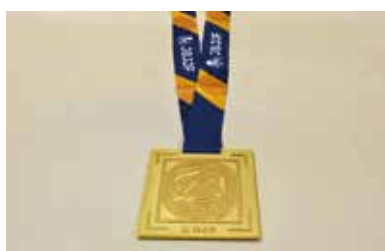
全日本選手権で獲得した金メダル