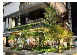
ホテル・オフィスの立地状況 (2022開業)