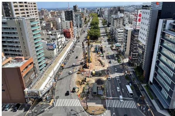
バスタ四日市周辺の工事状況