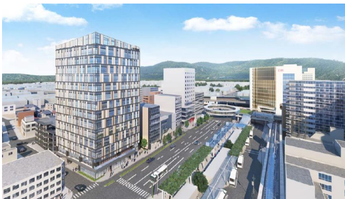
オフィスの建設イメージ(2025完成予定)