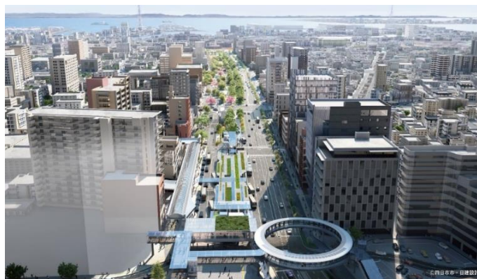
バスタ四日市を結ぶ円形デッキ