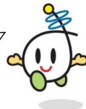
イメージキャラクター まなぼうや