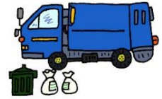
年末・年始 処理施設受入表