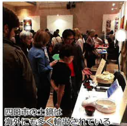
四日市の土鍋は海外にも多く輸出されている

市は、原油価格高騰に対応するため、施設園芸農家等に対する補助金に係わる補正予算案を、6月議会に上程し可決されました。しかし、他業種への支援策については、国や県の具体的な支援内容を見極めて、効果的な支援策を練り出す方針。担当者は「その間に市内の各業界がどのような支援を求めているかを情報収集していく」と話しています。市民生活や企業活動への影響を最小限に抑えるため、きめ細かな対応が求められます。