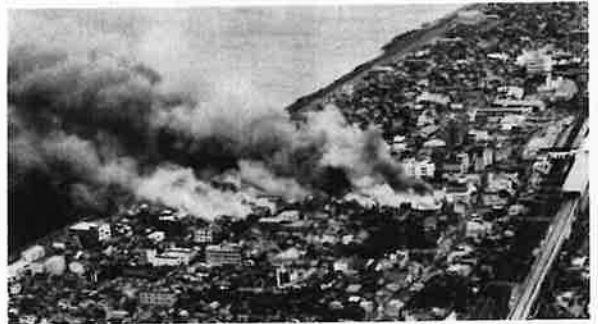
糸魚川駅前の大規模火災は、最大瞬間風速27mという強風により瞬く間に燃え広がった。

るかもしれない。しかし、実はこの四日市も、糸魚川に負けず劣らず局地的な風が吹く全国屈指のエリアとして知られているのです。西高東低の冬型気圧配置となっている状況において、伊勢平野は、日本列島の狭隘部の風下に位置することになります。それが「鈴鹿おろし」とよばれる西風となっており、四日市に吹き込むこととなります。