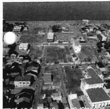
更地が広がる中、中央奥に緑に守られ燃え残った家屋が見える。

るかもしれない。しかし、実はこの四日市も、糸魚川に負けず劣らず局地的な風が吹く全国屈指のエリアとして知られているのです。西高東低の冬型気圧配置となっている状況において、伊勢平野は、日本列島の狭隘部の風下に位置することになります。それが「鈴鹿おろし」とよばれる西風となっており、四日市に吹き込むこととなります。