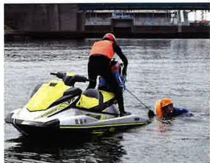
訓練を行う水上バイク隊員

スB）、触れ合いいきいきサロン等に対して感染症対策や活動の活性化にかかる経費等を支援することで、高齢者が活動を再開しやすい環境を整えます。コロナ禍においては、一部の高齢者が自宅に閉じこもりがちになるなど、心身の機能低下の進行が懸念されていました。