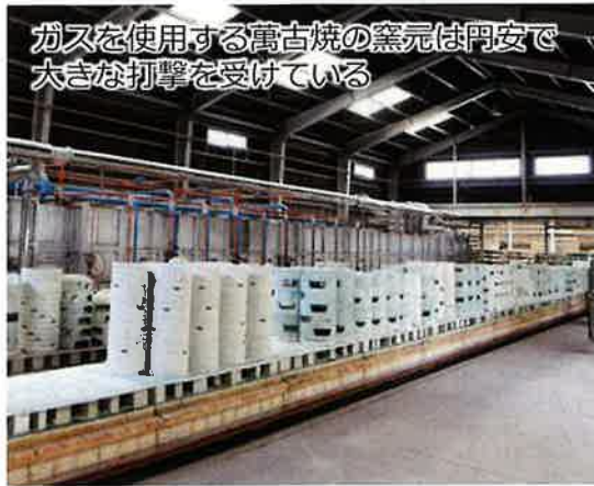
ガスを使用する富士焼の窯元は円安で大きな打撃を受けている

コロナ禍からの世界経済の回復に伴う原油の需要増や一部産油国の生産停滞、さらにロシアによるウクライナ侵略などの地政学的な影響で、国内の石油製品価格は13年ぶりの高値水準に達しています。政府は、これに対応するため燃料油価格の激変緩和と事業や各業界・業種ごとへの支援、地域の実情に応じた地方自治体独自の対策への財政支援などを目論んでいます。