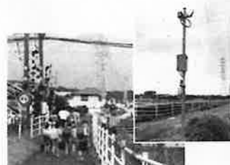
通学路の安全対策として、防犯カメラ設置の上、大通りから堤防道路に通学路を変更した八田第三自治会