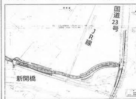
早期の計画実行が望まれる

生活道路には、国道23号の渋滞を回避しようとする通り抜けの自動車が多く、住民にとつて非常に危険な状況です。当道路が開通すれば、この抜け道解消となると期待されています。しかし、同計画の着手時期は未定で、早期の実行が望まれるところです。