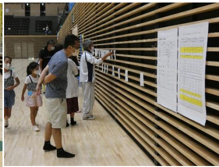
参考例：CP（チェックポイント）記入用紙