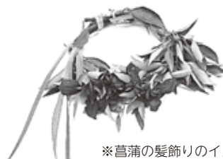
※菖蒲の髪飾りのイメージ