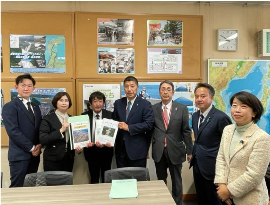
左から、川崎ひでと衆議院議員、末松則子鈴鹿市長、丹羽克彦道路局長、森智広四日市市長、小川謙四日市商工会議所会頭、石原正敬衆議院議員、山本佐知子参議院議員