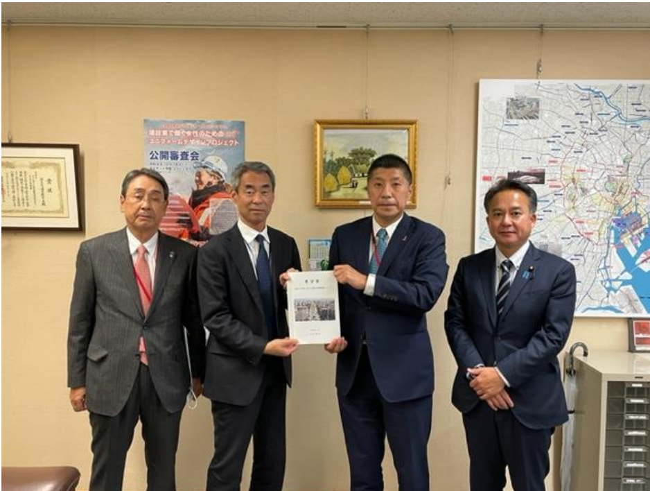
左から、小川謙四日市商工会議所会頭、天河宏文都市局長、森智広四日市市長、石原正敬衆議院議員