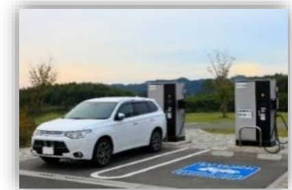
電気自動車と充電ステーション

温室効果ガスの排出削減や気候変動をリスクとしてだけとらえるのではなく、国のグリーン成長戦略もふまえ、 カーボンニュートラルの実現に向けた取組を産業・経済の発展につなげていく視点が重要