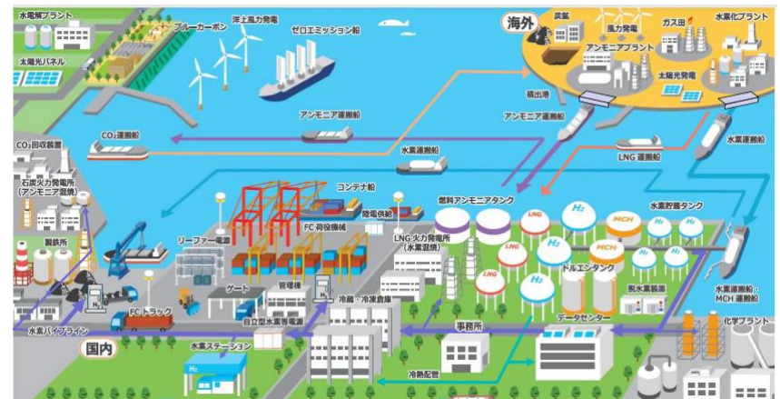
(カーボンニュートラルポートの形成イメージ)