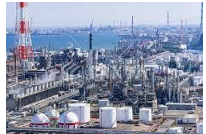
四日市コンビナート