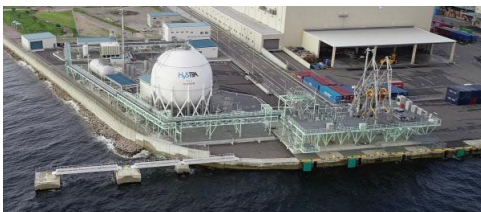
(液化水素の荷役基地：神戸市)