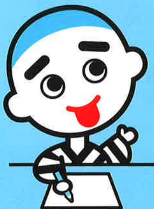
四日市市マスコットキャラクター こにゅうどうくん