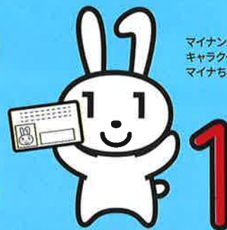
マイナンバーPR キャラクター マイナちゃん