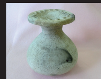
久留倍遺跡出土 弥生土器

8月3日(水) 10:00～12:00 小学6年生以上 (当日、参加自由、 先着6名程度)