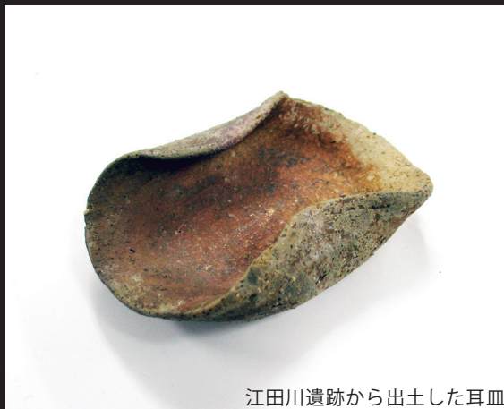
江田川遺跡から出土した耳皿