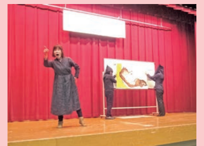
▲四日市手話祭での発表

市内には九つの手話サークルがあり、地区市民センターや総合会館などで活動しています。