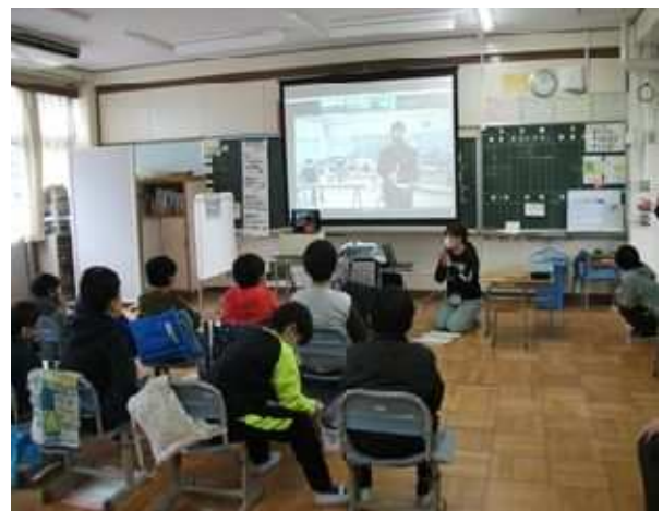
<令和2年度 三泗特別支援学級学習発表会>