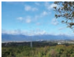
城山公園 頂上から見た鈴鹿の山並み。四季それぞれに違った表情があり、飽きることがありません。東名阪自動車道も遠望できます