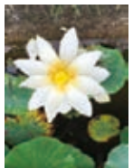
南部丘陵公園のハス(みさりんさん)