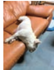
こんな所で眠っちゃうなんて!落っこちちゃうよ~(まるくんママさん)