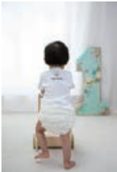
1歳のお誕生日おめでとう♥一人で歩けるようになって、たくましいぞっ!(ばんぶうさん)