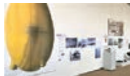
展示風景 (3階ロビー)

戦後、新たに分かってきたことも含め76年前の事実と向き合い、「いま」の暮らしを見つめ直す機会にいただければと思います。