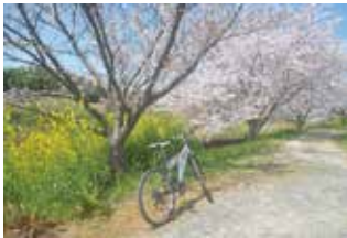
千本桜の鹿化川。延々と続く桜並木をサイクリングすると最高です！ (みつくすじゅうすさん)