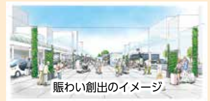
賑わい創出のイメージ

コロナ禍で厳しい状況の中、本市の成長を描くことのできる、希望のあふれる明るいニュースとなりました。