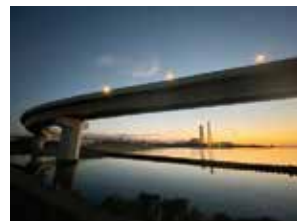
川越火力発電所が見える天力須賀です。日の出前の霞4号幹線と海の風景です