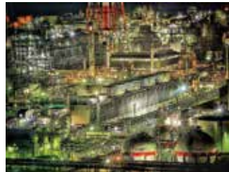
四日市ポートビルから見える夜景です (遊前さん)