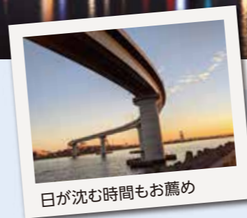
日が沈む時間もお薦め