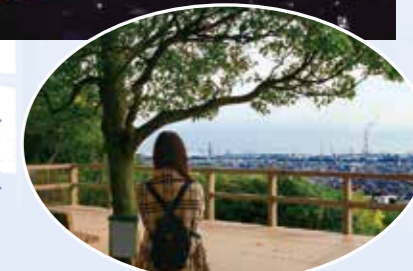
デートスポットとしても人気! また来たいな