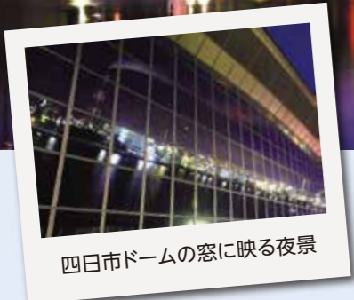
四日市ドームの窓に映る夜景