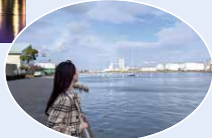
四日市ドームの裏にこんなスポットがあったんだ