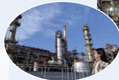
間近に見ると迫力満点!