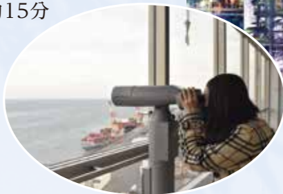
名古屋駅まで見えるよ