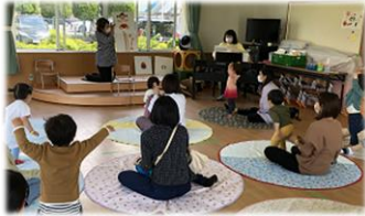
普段の午前中は幼児の遊び場になっています。

『ほっくん』と『くがちゃん』は2017年に富洲原小学校6年の3人の女の子が考えてくれたマスコットキャラクターです。みんなよろしくね♪