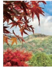
「もみじ谷」から山の紅葉と。谷は緑が多くてまだまだこれからのもようでした。※11月中旬撮影(みさりんさん)