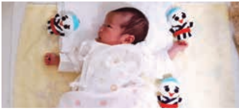
こにゅうどうくんと四日市が大好きになったらいいなあ。(こっていーさん)