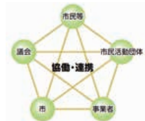
市民協働の担い手と領域のイメージ

本市では、市民協働を「市民等、市民活動団体、議会、事業者及び市等が連携し、それぞれが持つ特性を生かしてまちづくりに取り組むこと」と定義しています。