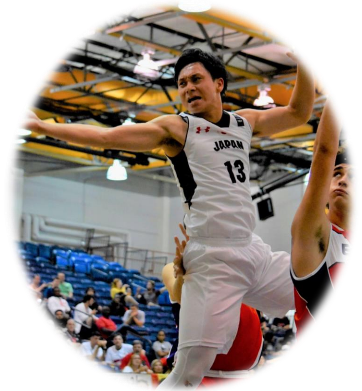
日本代表・津屋一球選手