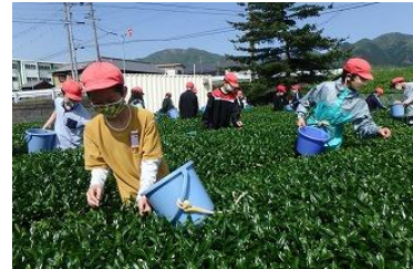
お茶 栽培活動 (水沢小)