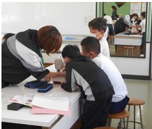
家庭科の学習支援 (三重小)