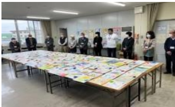
高齢者に色紙を贈る取組 (三滝中)