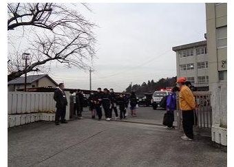
下校見守り運動 (桜中)