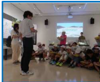
久留信官衛遺跡学習（大矢知興讀小）