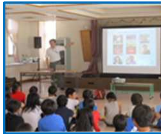
夢たまごの作成（河原田小）