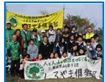
城山の里山保全活動（三重西小）