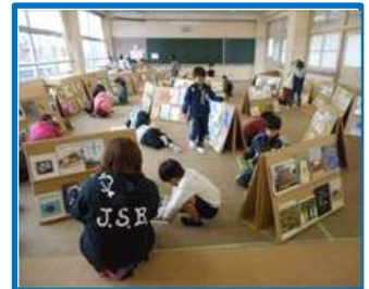
絵本の広場（神前小）