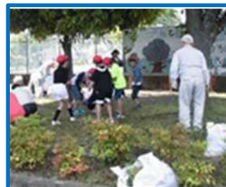
クリーン作戦（高花平小）