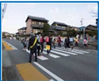
子ども見守り隊（大谷台小）