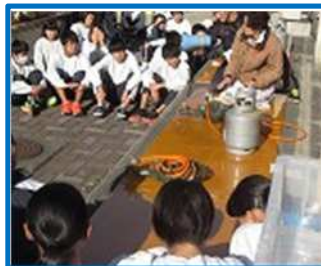
炊出し訓練（富田中）