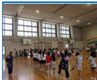
日永つんつくおどり体験（日永小）