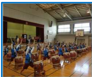
太鼓演奏指導（中央小）