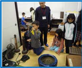
郷土資料室（中部西小）