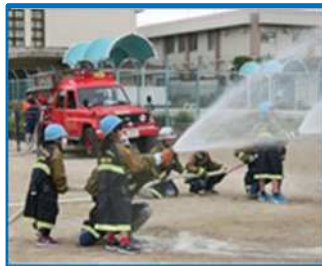
防災教育（富洲原小）