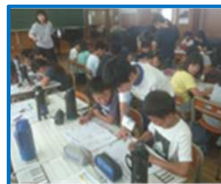
川島こども未来塾（三滝中）