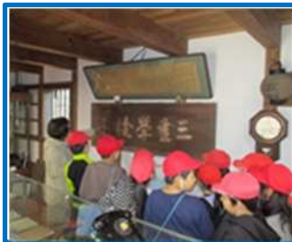
町たんけん（三重小）