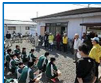
地域清掃活動（笹川中）