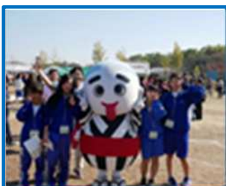
八郷フェスタ（朝明中）