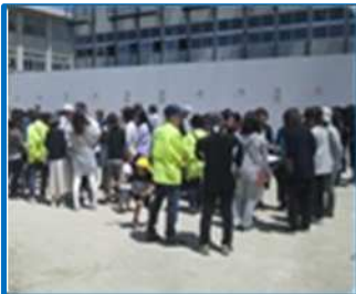
地域の見守り（海蔵小）

子どもたちの安全・安心のため、学習環境の整備や防犯・防災の取り組みを進めています。