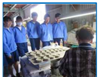
地域学習「産業」（山手中）