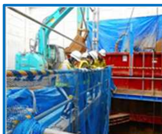
仕事体験（八郷西小）