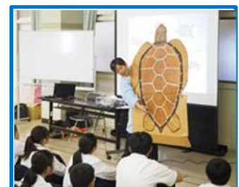
ワミガメのふるさと（楠中）