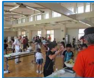
防災土鍋体験（桜小）