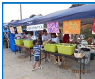
三世代交流フェスタ（三重平中）