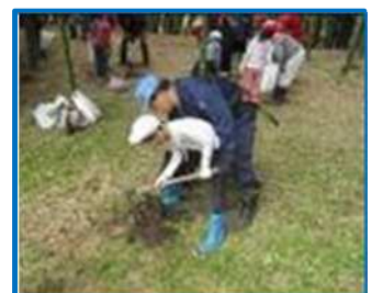
たけのこ掘り体験（三重北小）