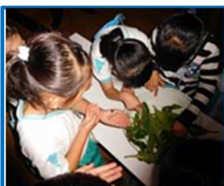
ホテル学習（内部東小）