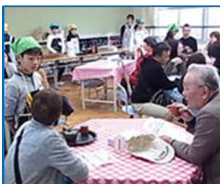
お茶カフェ（水沢小）