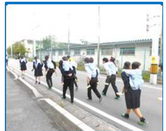
合同避難訓練（富洲原中）

学校・地域の協働した取り組みを通じて、地域づくりに貢献したり、地域の伝統文化にふれたりしています。