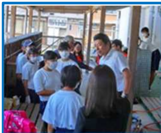
共同地区防災訓練（中部中）