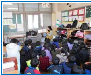
本の読み聞かせ（内部小）