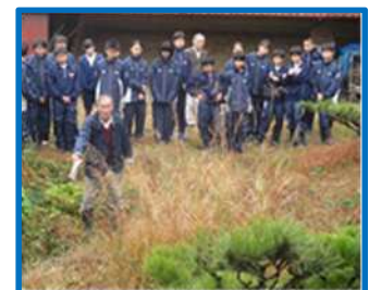
御池沼沢学習（大池中）