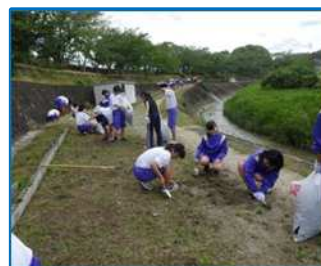
フラワーオアシス（桜中）