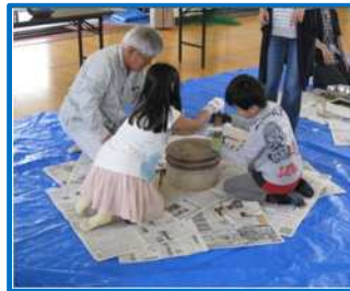
石臼引き体験（下野小）