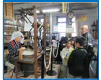
四郷郷土資料館（四郷小）