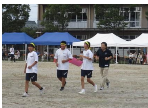
地元村山議員と一緒に走る生徒