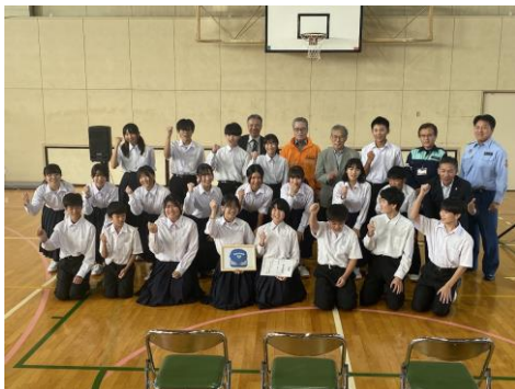
10月 橋北中学校での防災部結成式