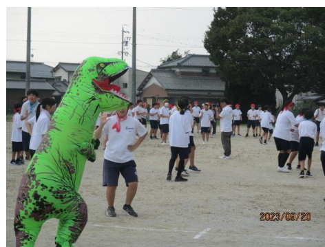
社協の恐竜の着ぐるみと踊る生徒