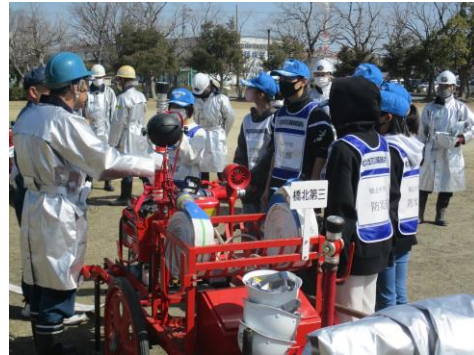
5月 三滝公園での橋北消防フェスタ 2024