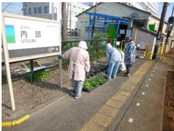
花植え作業の様子（沿線地域の協力）

今後も、地域の皆さまから愛着の持てる身近な鉄道として、安心・安全で信頼できる鉄道であり続けていくため、皆さまのご意見をいただければ幸いです。