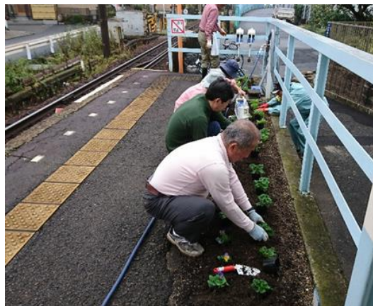
花植え作業の様子（沿線地域の協力）