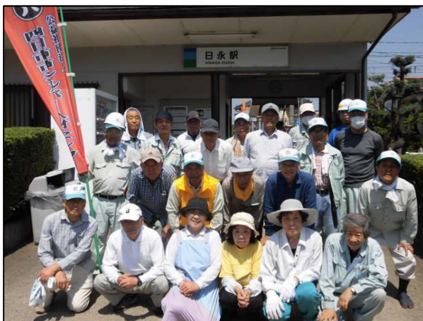
地域ボランティアによる駅の清掃活動

今後も、地域の皆さまから愛着の持てる身近な鉄道として、安心・安全で信頼できる鉄道であり続けていくため、皆さまのご意見をいただければ幸いです。