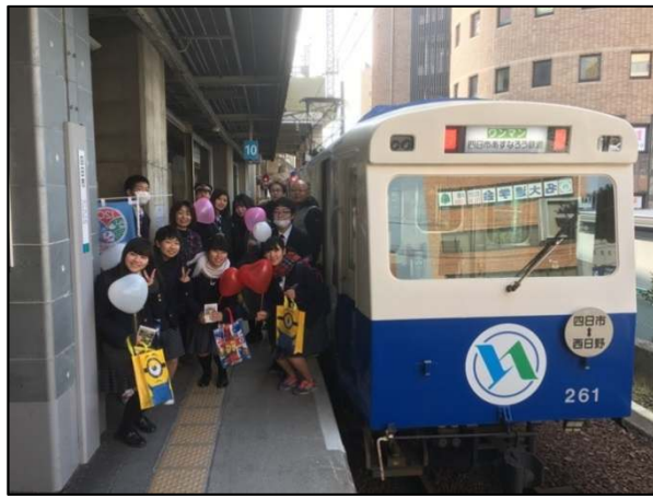
沿線高校・地元主催のイベント列車