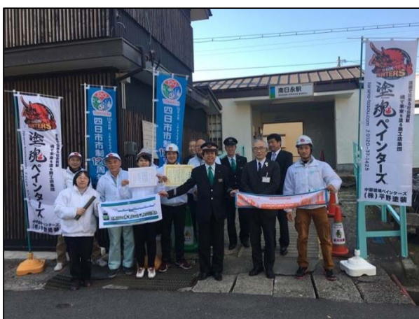
企業ボランティアによる駅の塗装活動