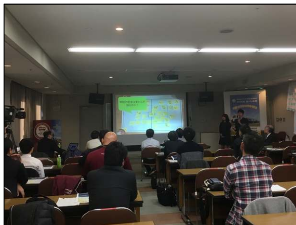
沿線高校・地元が連携したシンポジウム