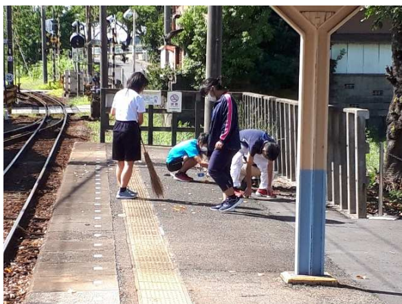
清掃作業の様子（沿線学校の協力）

今後も、地域の皆さまから愛着の持てる身近な鉄道として、安心・安全で信頼できる鉄道であり続けていくため、皆さまのご意見をいただければ幸いです。