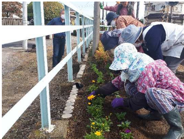
花植え作業の様子（沿線地域の協力）