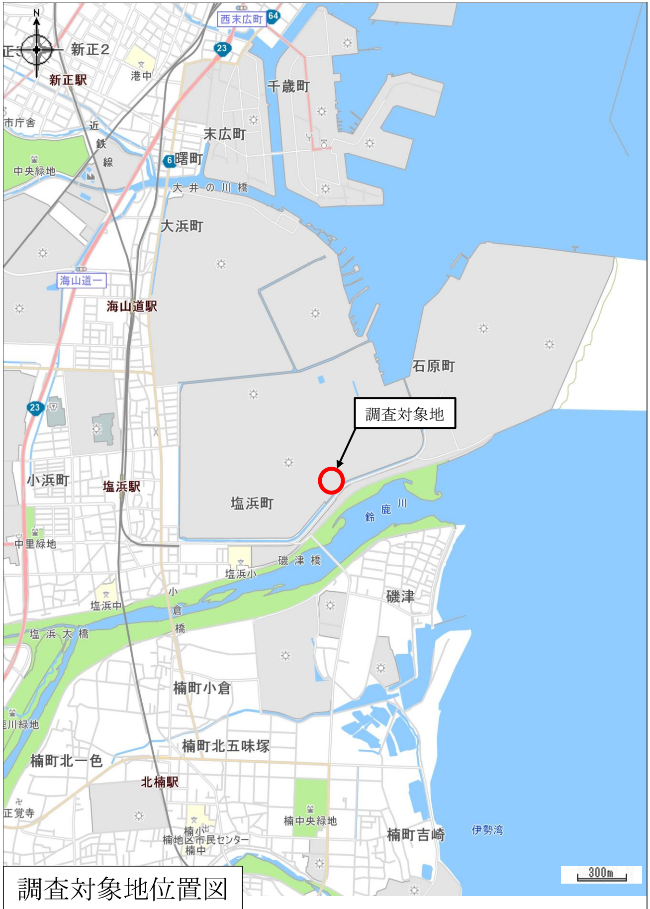
調査対象地位置図