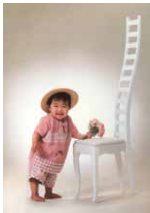
子どもの頃の川嶋選手→