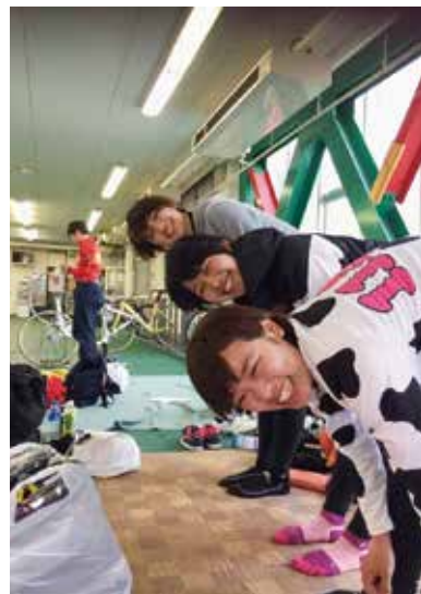
ガールズケイリン選手 の友人たちと→

競輪選手になってからは、強い選手と戦えるという楽しさもありますし、レースもスピード感があってすごく楽しいです。この前けがをしてしまって、そういうときはつらくなるんですけど、また1着を取れるように頑張っ練習していきます。