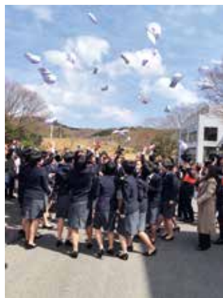
日本競輪学校卒業式→