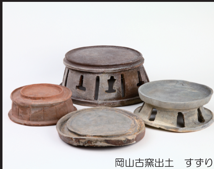
岡山古窯出土 すずり