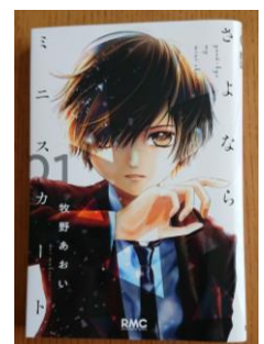
さよならミニスカート ©牧野あおい/集英社